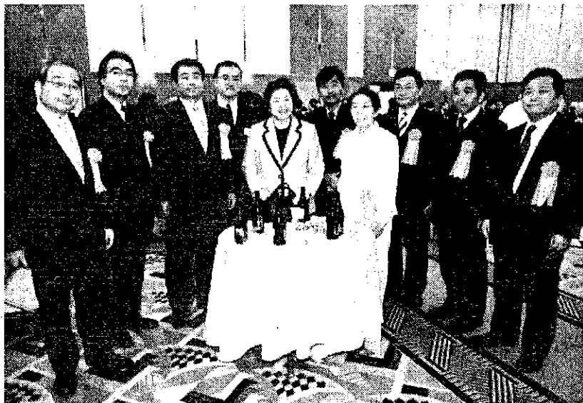
受賞後のパーティーで堂本暁子千葉県知事を囲んで

県内の優秀経営者を表彰する「千葉県企業ベンチャー経営者表彰」も今年で11回目を迎えた。受賞経営者の年齢、創業年数、業種はさまざま。これまでの受賞企業を振り返る。